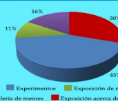
Gráfico 2. ¿Qué actividad de esta plática te causó mayor interés? Grupo 1313. Feria Educativa, Colonia Impulsora, Nezahualcóyotl, Estado de México, Octubre 2017. Archivo de grupo.

¿Qué actividad de esta plática te causó mayor interés?