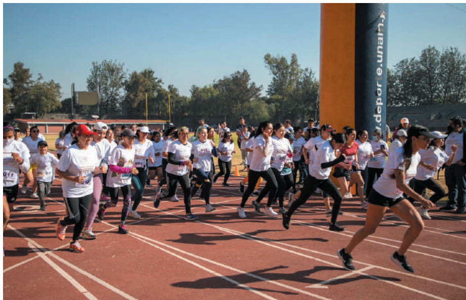
La carrera atlética fué realizada en el Estadio de prácticas Roberto “Tapatío” Méndez.

una opción de formación académica, coincidieron.