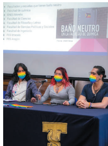
Proyecto que responde a las necesidades de la comunidad ENTS.

1) Estado del arte, donde se recuperó la experiencia de otras facultades con baños neutros, mediante sondeo y recorridos, se estableció un grupo focal, con el objetivo de recabar diversas