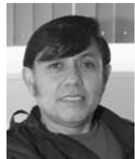
Víctor Inzúa Canales "Trabajo infantil" Gaceta UNAM 13/06/07