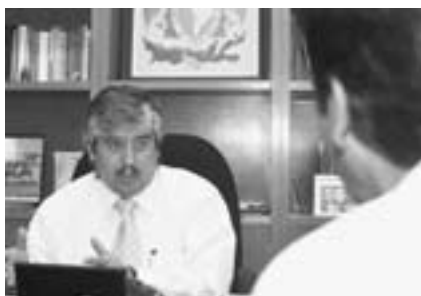
Salvador Alvarado Garibaldi "Desintegración social en los jóvenes" Gaceta UNAM 11/06/07