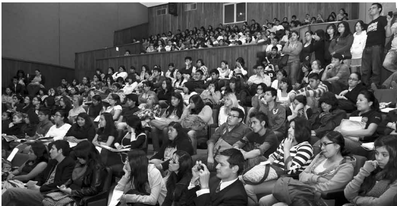
Promover el ejercicio del intercambio académico e invitar a la comunidad estudiantil a hablar de sus incursiones en otras ciudades desde la visión de los trabajadores sociales.

y el contexto se ubican en un mismo plano y buscan facilitar que todas las personas desarrollen plenamente sus potencialidades. Los trabajadores sociales se consideran agentes del cambio en la vida de las personas, familias y comunidades para las que trabajan.