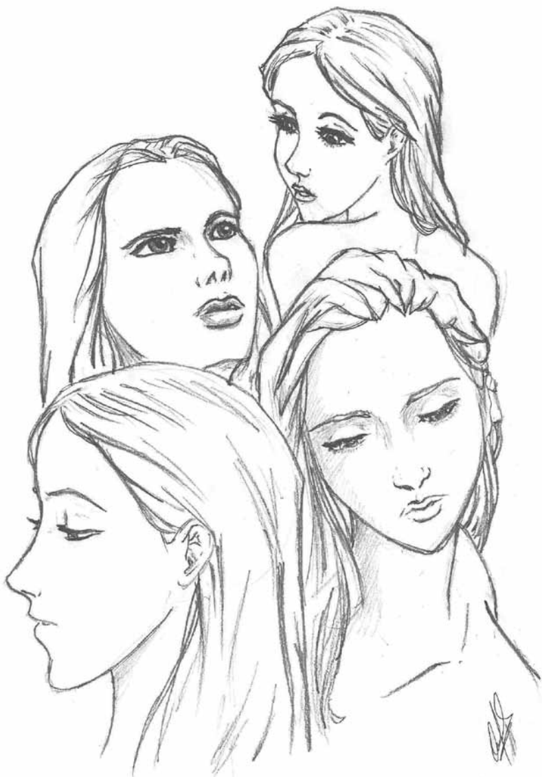
ILUSTRACIÓN: OSCAR MAYA

en el tema continuó con su maestría y doctorado en sociología en la UNAM, donde pudo abordar con mayor detenimiento cómo los prejuicios, la misoginia y la moral represiva se fortalecen en un marco económico y político más amplio, como la globalización: “Este marco abastece un mercado cada vez más sofisticado, entre cuyas demandas se ofertan las sexuales, con todas las implicaciones que esto conlleva, por esta razón incorporamos ese elemento en el marco contextual”.