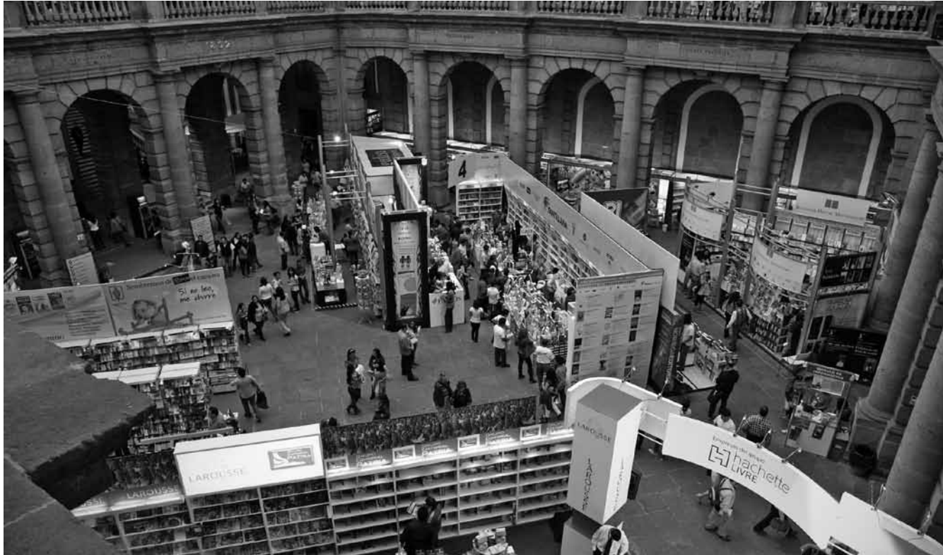
La Feria de Minería, un espacio plural para hablar del Trabajo Social.

aceptado, puede desarrollar una buena relación de pareja, sin embargo cuando la relación es castrante, el desarrollo del niño puede presentar deficiencias que incidan en sus relaciones futuras de pareja, concluyeron a grandes rasgos.