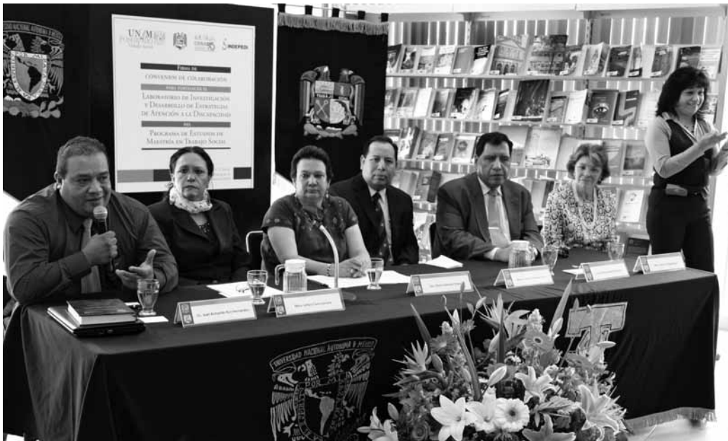
La academia se acerca a las necesidades sociales del país.

La firma se realizó en las instalaciones de la biblioteca de la Escuela Nacional de Trabajo Social el 4 de septiembre