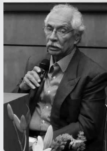
Esfuerzo institucional. Contreras

Destacó que en el curso habría 16 especialistas con experiencia en diversas instituciones determinantes para el mundo de la salud en nuestro país, lo que significaba un privilegio para los que lo cursaran. Finalizó diciendo que el curso tenía consistencia con los esfuerzos que el rector José Narro implementa para ampliar la cobertura de las actividades que la UNAM puede ofrecer.