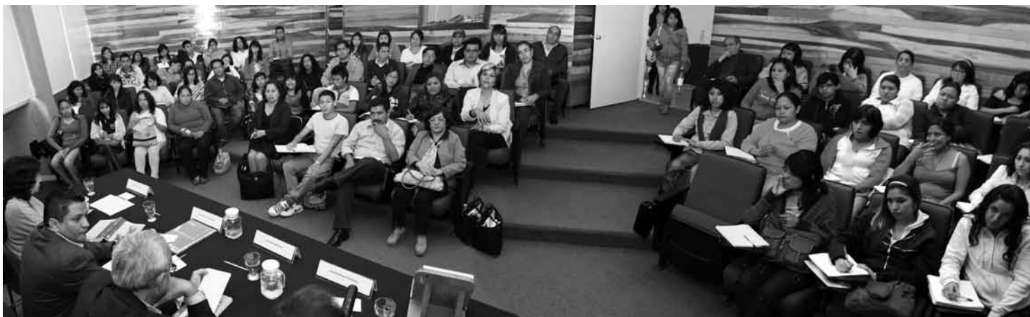
Afluencia significativa de alumnos.

el significado y alcance de la participación de los jóvenes, así como sus relaciones sociales y cuáles serían las mejores estrategias para la creación de ciudadanía, seguido por Introducción al arte de la investigación , de Guillermo Campos y Covarrubias.