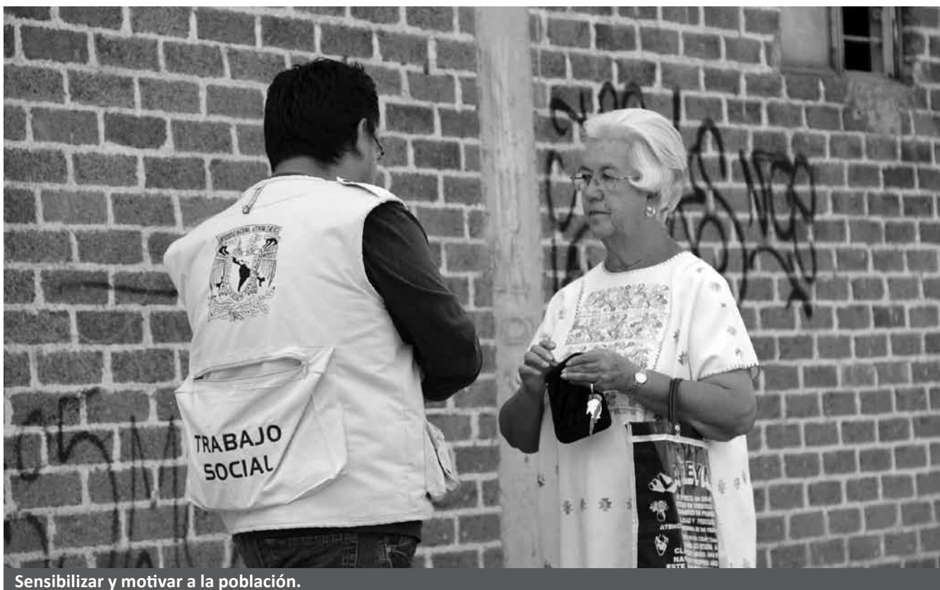
Sensibilizar y motivar a la población.

porque a pesar de ser la delegación con más alto índice de desarrollo humano, tiene un registro de 2,032 casos denunciados en el 2010, lo que lo convierte en un fenómeno que demanda identificación y atención inmediata.