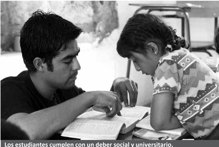
Los estudiantes cumplen con un deber social y universitario.

Aclaró que los trabajadores sociales están obligados a buscar una infraestructura digna, un trato respetuoso, apoyo logístico, asesoría e incentivos necesarios, así como a mantener siempre los acuerdos de trabajo señalados en la solicitud registrada y aprobada en la UNAM y en la Escuela Nacional de Trabajo Social, al buscar un lugar donde