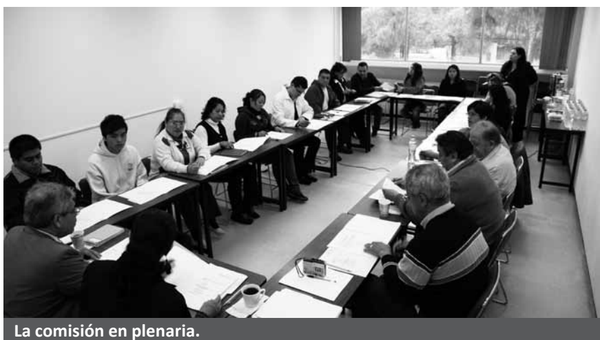
La comisión en plenaria.